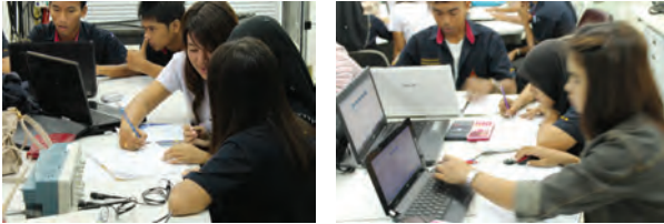
ภาพที่ 2 กิจกรรมในขั้นตอนการคำนวณหลังจากฟังการบรรยาย

หัวข้อนี้จะกล่าวถึงการใช้กระบวนการจัดการเรียนการสอนโดยใช้แนวคิดการสอนน้อยแต่เรียนรู้มาก เพื่อประยุกต์ใช้กับการเรียนการสอนในรายวิชาการวิเคราะห์วงจรไฟฟ้า สำหรับนักศึกษาสาขาวิชาวิศวกรรมเมคคาทรอนิกส์ คณะครุศาสตร์อุตสาหกรรมและเทคโนโลยี มหาวิทยาลัยเทคโนโลยีราชมงคลศรีวิชัย ซึ่งได้ผสมผสานกับลักษณะการสอนทางวิศวกรรม ที่ผู้วิจัยได้ศึกษาค้นคว้า(ตามหัวข้อที่ 2) และคาดว่า เป็นกิจกรรมการสอนที่เหมาะสมกับการเรียนรู้ทางด้านวิศวกรรม ซึ่งผลที่ได้จากการทดลองนั้นเป็นภาพที่สื่อถึงสภาพการจัดการเรียนการสอนที่เกิดขึ้นจริงดังภาพที่ 2 ถึง ภาพที่ 5