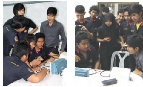
ภาพที่ 5 การจัดการเรียนการสอนโดยมีผู้สอนแนะนำให้ความรู้รายกลุ่ม

ความคิดของผู้เรียนให้เป็นการเรียนรู้แบบยั่งยืนและผู้สอนยังสามารถควบคุมชั้นเรียนได้ง่าย กล่าวคือผู้สอนสามารถแก้ปัญหาการเรียนให้แก่ผู้เรียนเฉพาะกลุ่มที่มีปัญหาการเรียนได้โดยแสดงการควบคุมชั้นเรียนได้ดังภาพที่ 5 ซึ่งมีการแก้ไขจากปัญหาความแตกต่างของระดับความรู้ของผู้เรียน