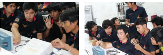
ภาพที่ 4 กิจกรรมในขั้นตอนการวัดทดสอบ

จากพฤติกรรมในภาพที่ 2-4 นั้นแสดงให้เห็นถึงการจัดการเรียนการสอนโดยใช้แนวคิดการสอนน้อยแต่เรียนรู้มากเป็นกระบวนการที่เน้นผู้เรียนเป็นสำคัญซึ่งทำให้ผู้เรียนสามารถมีกิจกรรมการเรียนรู้ร่วมกันและยังมีแรงจูงใจสำหรับการเรียนในวิชาที่มีการคำนวณเยอะ