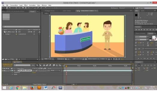
ภาพที่ 3 ตัวอย่างการออกแบบฉากหลัง