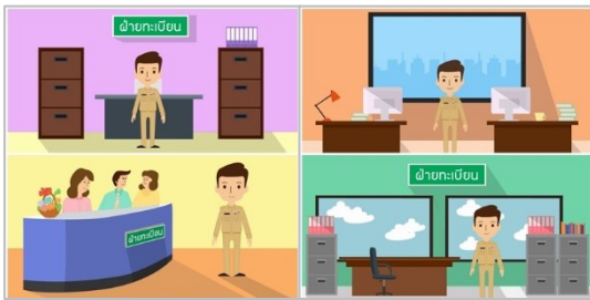
ภาพที่ 4 ตัวอย่างการทำให้เคลื่อนไหว