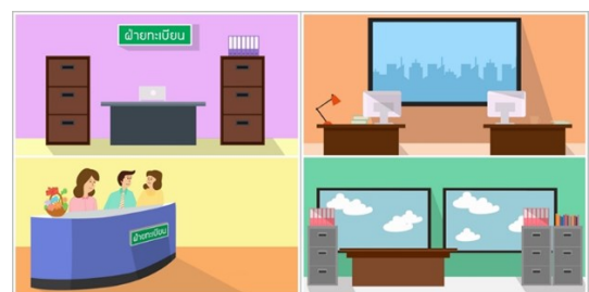
ภาพที่ 2 ตัวอย่างตัวละครนายทะเบียน

ออกแบบตัวและคร ฉาก และอุปกรณ์อื่นๆ ด้วยโปรแกรม Adobe Illustrator หลังจากนั้น ทำให้ตัวละครและองค์ประกอบต่างๆ เกิดการเคลื่อนไหวตามบทที่ได้เขียนไว้ในแต่ละฉาก ด้วยโปรแกรม Adobe After Effect